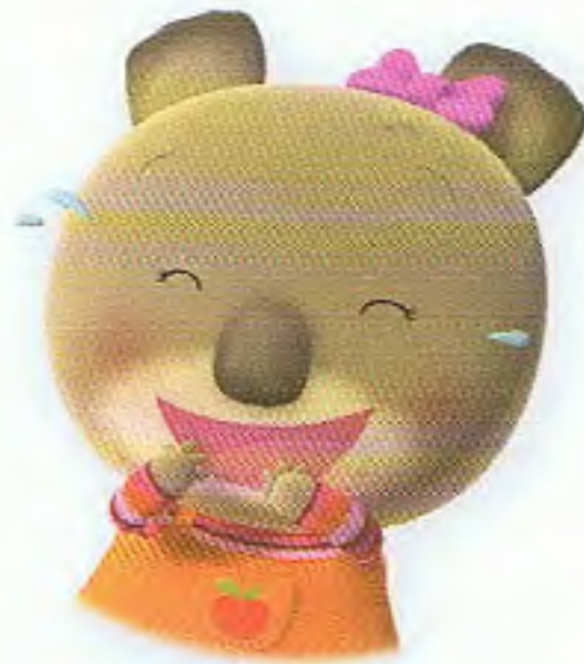
ضَحِكٌ بِأَعْلَى صَوْتِهِ